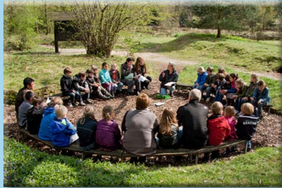
101 Groene Klaslokalen