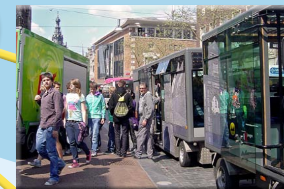
Nijmegen meest energiezuinige stad