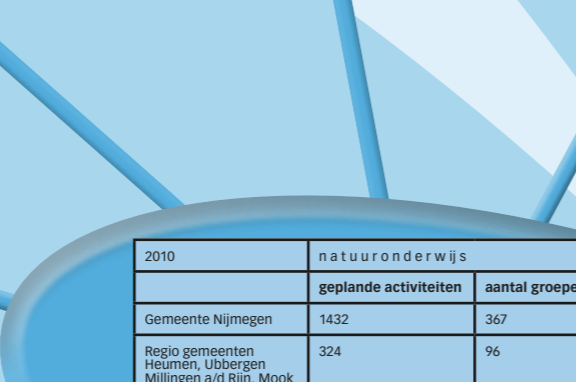
Groene Maatschappelijke Stage