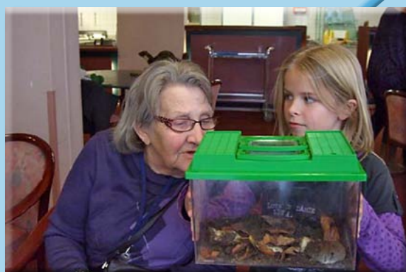
Natuur voor de zorg